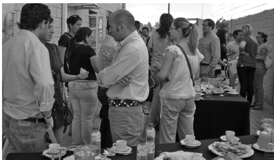
Asistentes a las jornadas de puertas abiertas de Proface en Badajoz.

Unas 40 personas acudieron a las jornadas de puertas abiertas organizadas por el Programa Proface en Badajoz el pasado mes de julio. En este encuentro informativo, que congregó a técnicos, emprendedores y desempleados, se dieron a conocer los servicios gratuitos que ofrece el Programa, así como las novedades en materia fiscal y laboral