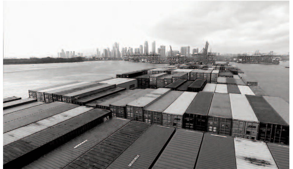
La Estrategia de Internacionalización proyecta el futuro de las exportaciones extremeñas hasta 2020

Con estas cifras en la mano y tras un análisis detallado del comportamiento de las exportaciones en la región, el Gobierno extremeño pretende atacar aquellos pun-