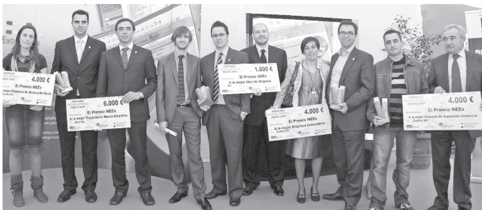
Ganadores de la pasada edición de los premios NEEEx

En la última fase de esta convocatoria se han seleccionado 15 finalistas que deberán defender su proyecto o empresa ante